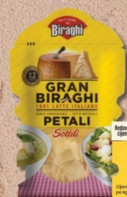
Sir svježe rendani Gran Biraghi 100 g

Redovna cijena 5,39 eur -37% 3,39 eur Cijena po kg 42,38 eur