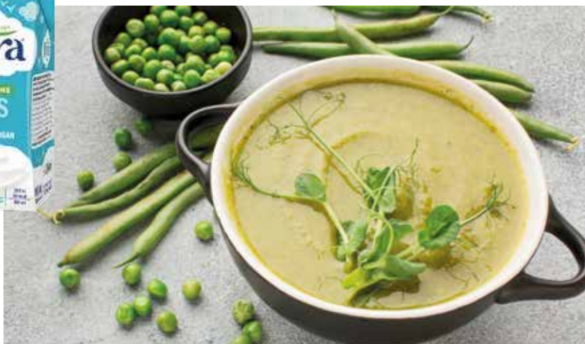
Krem potaž od graška