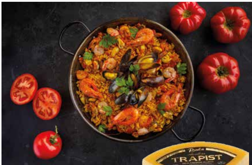
Rižoto sa plodovima mora