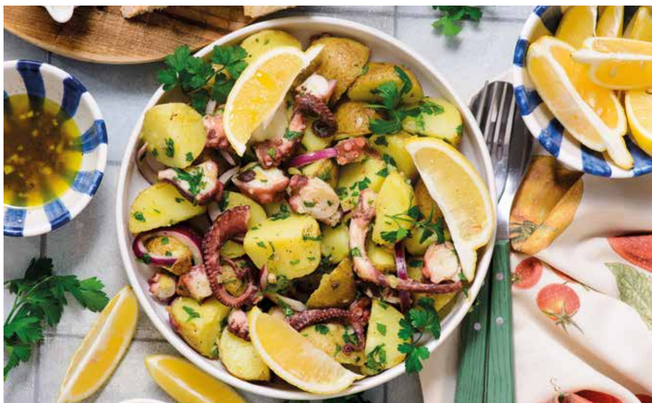
Salata od hobotnice sa krompirom