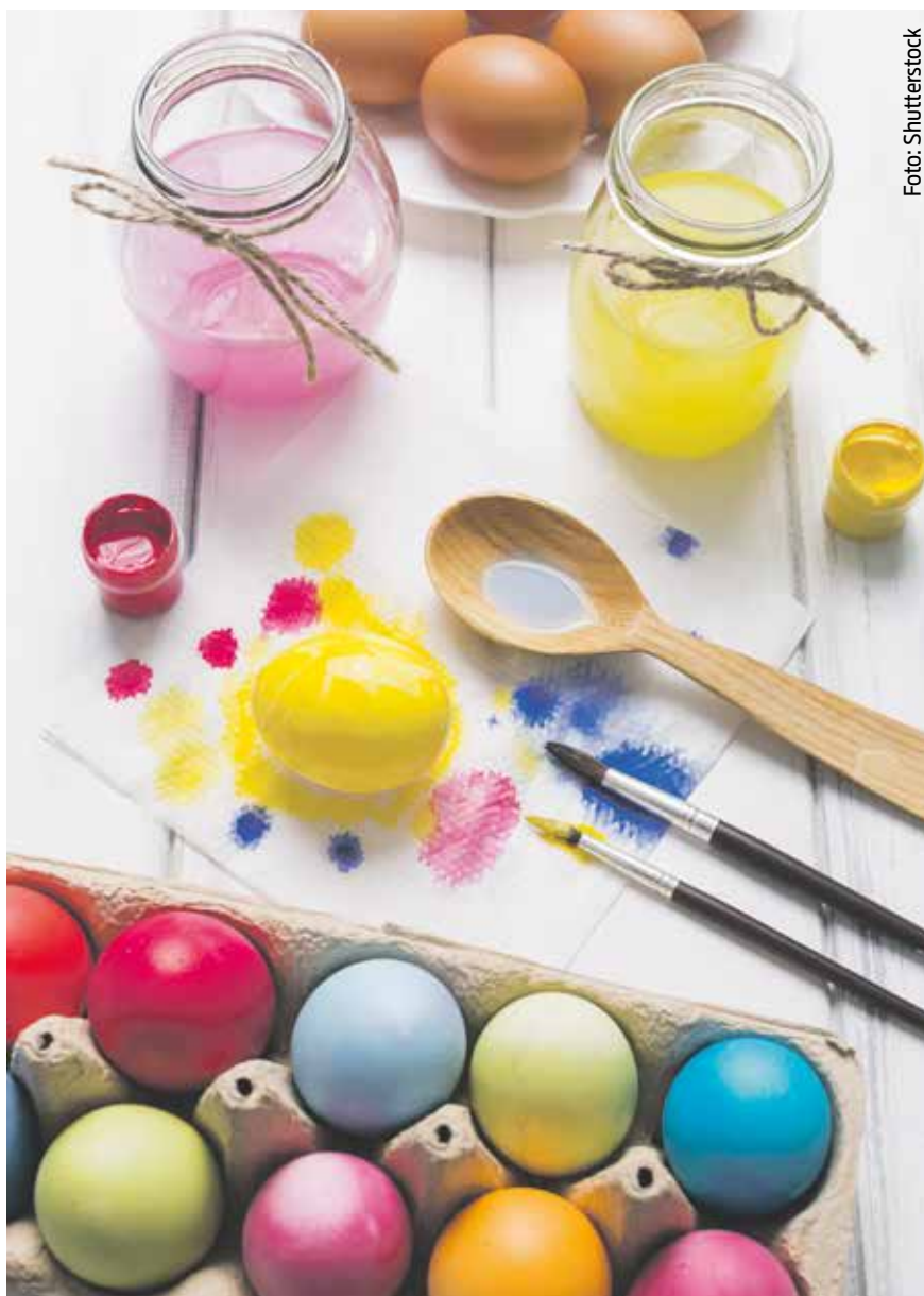
Farbanje jaja kupovnim bojama