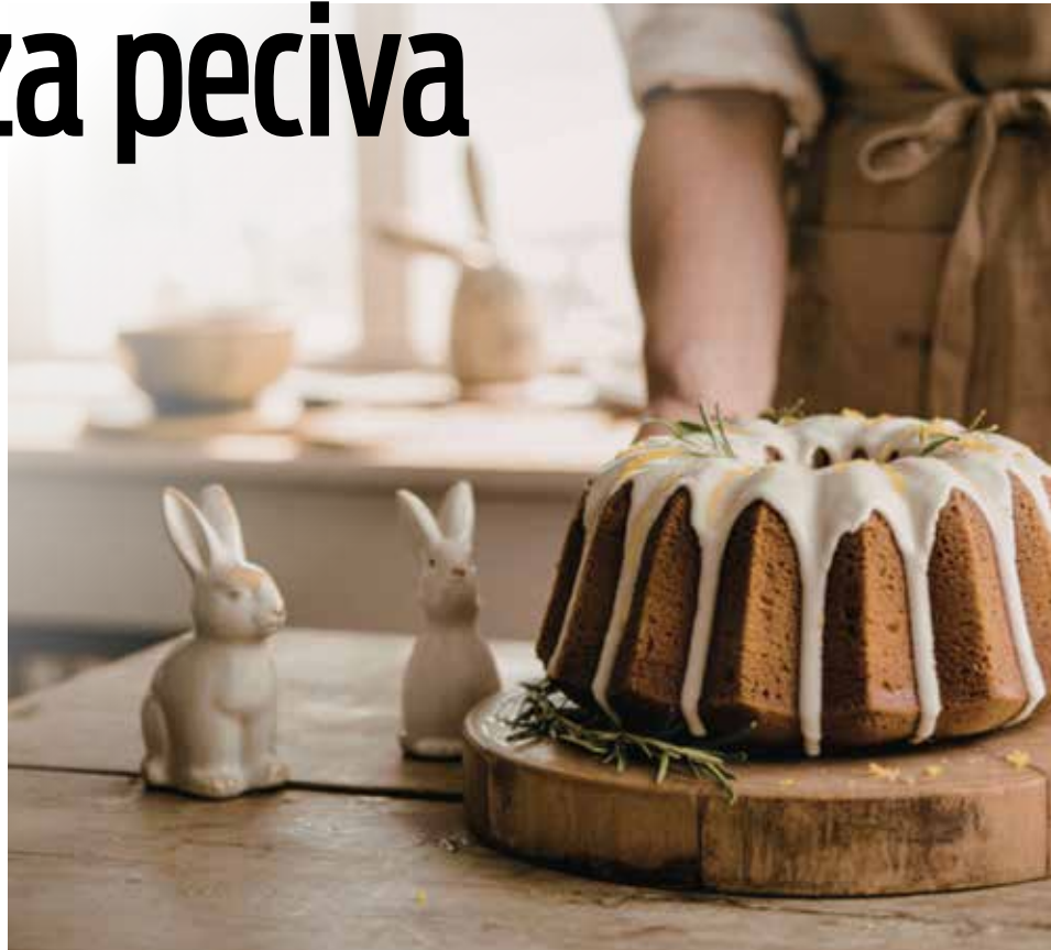
Osim što su ukusna, peciva su i lijep ukras

U mlako mlijeko dodajte kvasac, kašičicu šećera i malo brašna, pa ostavite desetak minuta da nađe. U većoj posudi pomiješajte brašno, ostatak šećera, vanilin šećer i so. Dodajte jaja, nadošli kvasac, otopljeni maslac i limunovu koru. Zamijesite glatko i mekano tijesto, pa ga ostavite pokrivenog oko sat vremena da naraste. Tijesto podijelite na tri jednaka dijela i od svakog oblikujte dugu traku. Ispletite pletenicu i pažljivo je prebacite u pleh obložen papirom za pečenje. Ostavite još 20 do 30 minuta da odmori. Premažite žumancetom. Pecite u zagrijanoj rerni