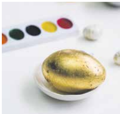
Zlatni i sjajni efekti

Kad se jaja osuše, premažu se sa malo ulja ili slanine da dobiju lijep sjaj.