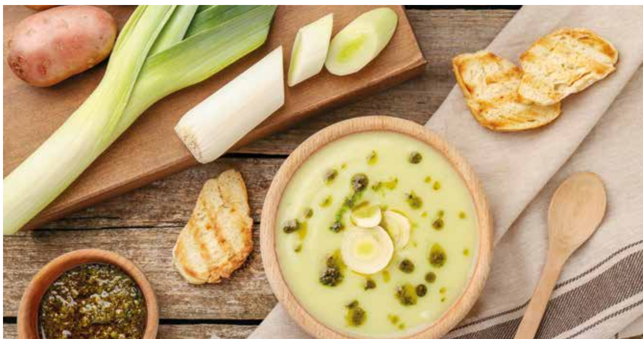
Prolječna čorba sa prazilukom

povrće ne omekša. Sve izmiksajte u glatku kremastu masu, dodajte pavlaku za kuvanje, posolite i pobiberite. Po želji dodajte malo svježe nane za lagan i prolječni ukus. Služite toplo.