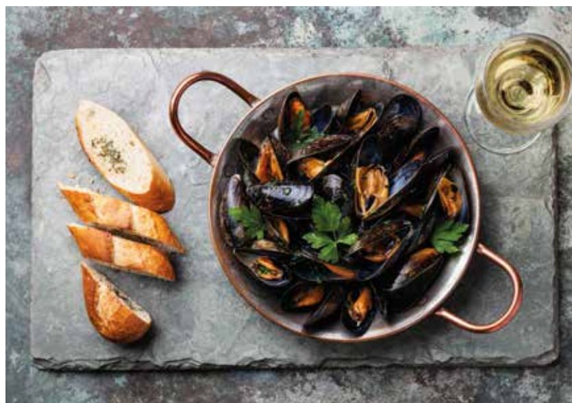
Mušlje na buzaru

Crni luk sitno isjeckajte i propržite na ulju dok ne postane staklast. Dodajte