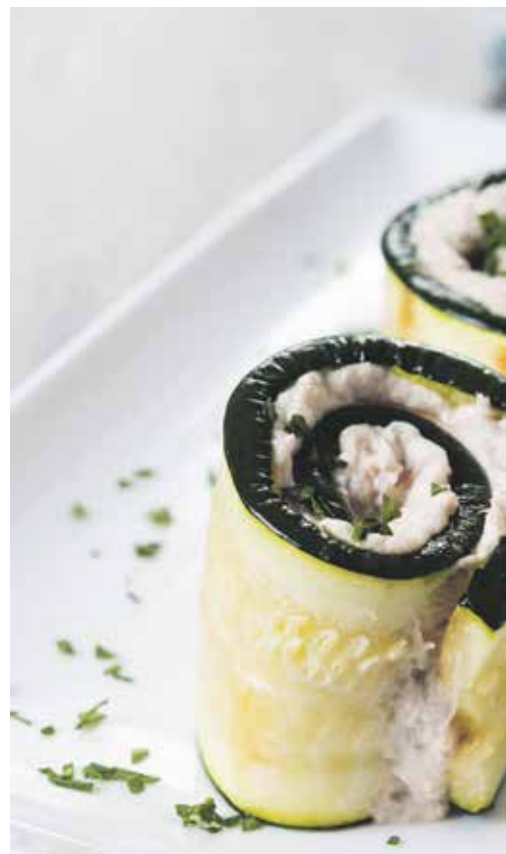
Rolnice od patlidžana sa sirom

Ovo predjelo je ukusno i toplo i hladno. Za svečaniji izgled možete