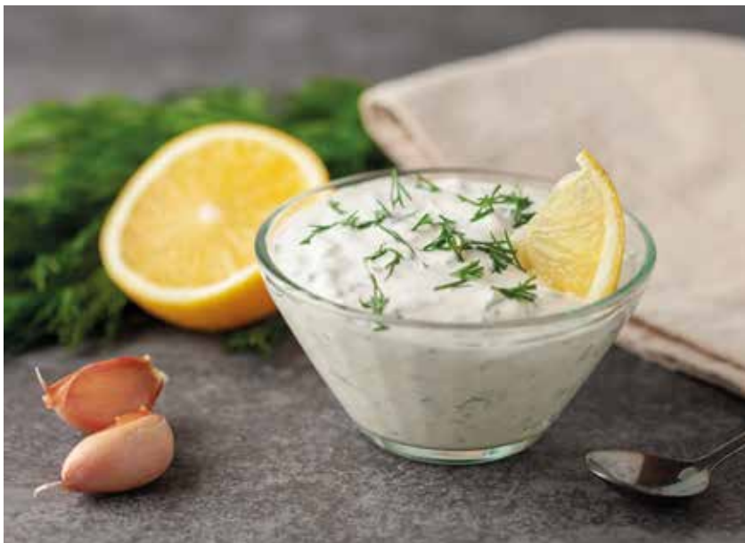
Pavlake sos sa limunom i mirođijom

Jednostavan i vrlo zahvalan uz pečeno meso i krompir.