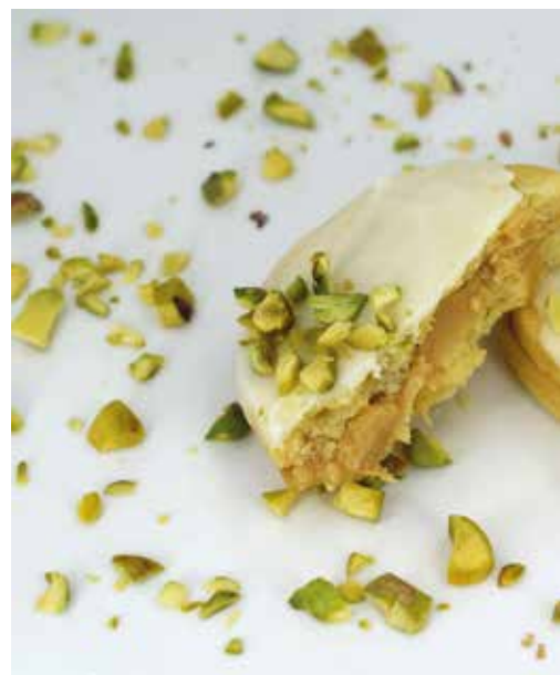
Kolači sa pistačima