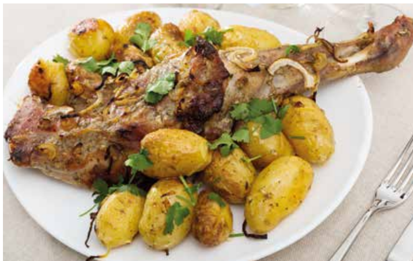
Jagnjetina iz rerne

Jagnjeće kotlete operite i dobro posušite kuhinjskim papirom. U činiji pomiješajte maslinovo ulje, sitno sjeckani bijeli luk, ruzmarin, majčinu dušicu, limunov sok, so i biber. Tom marinadom premažite kotlete i ostavite ih da odstoje najmanje 30 minuta, a po mogućnosti i duže. Zagrijte tiganj, gril tiganj ili rernu. Kotlete pecite po nekoliko minuta sa svake strane, u zavisnosti od debljine, dok lijepo ne porumene. Ako ih pečete u rerni, složite ih u pleh, prelijte ostatkom marinade i po želji dodajte malo bijelog vina. Pecite na 200 stepeni oko 20 do 25 minuta. Ostavite meso nekoliko minuta da odmori prije služenja.