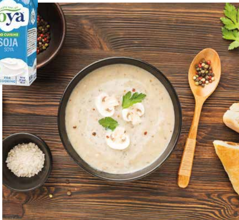
Krem potaž od pečuraka