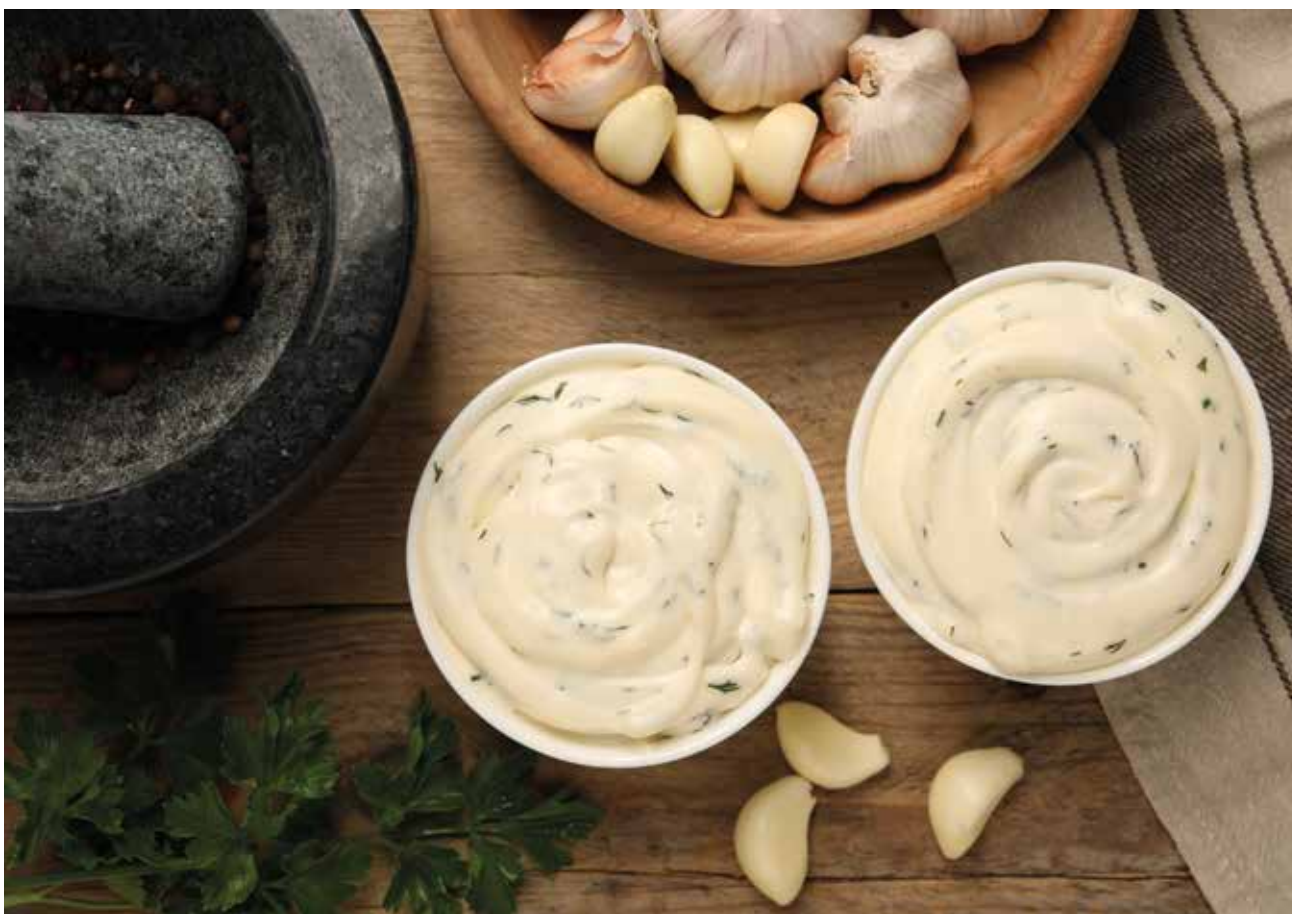
Sos od pavlake i bijelog luka