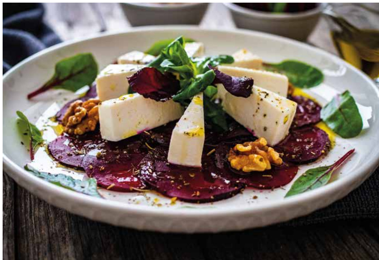
Salata od cvekle, mladog sira i oraha