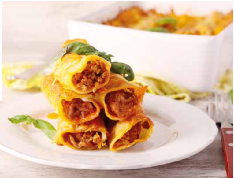
Kanelone sa mesom

meso i krompir. Ako spremate u rerni, pokrijte tepsiju folijom i pecite na 220 stepeni oko sat i 30 minuta, pa otkrijte i pecite još 30 minuta. Jelo je gotovo kada meso omekša, a krompir dobije lijepu zlatnu koranicu.